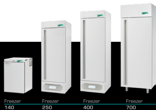
Freezer 140 Freezer 250 Freezer 400 Freezer 700

Freezer range includes professional units with temperature range settable between -10 and -25°C, from 140 to 1500 liters capacity. Thanks to their reliability, they can store in totally safe conditions biological and laboratory samples and comply with the different needs of the medical field.